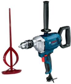
Misturador com Hélice Helicoidal