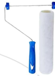
Rolo de lã sintética ref. 1365.

Nota: As imagens acima são de caráter ilustrativo e didático, com o intuito de facilitar a identificação do tipo de equipamento a ser utilizado, não estamos vinculados a nenhum fornecedor de ferramentas.