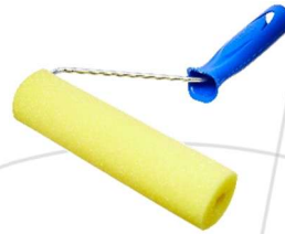
Rolo de espuma ref. 1341.