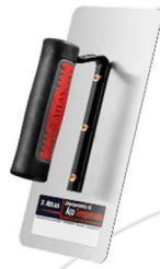
Desempenadeira Metálica Lisa