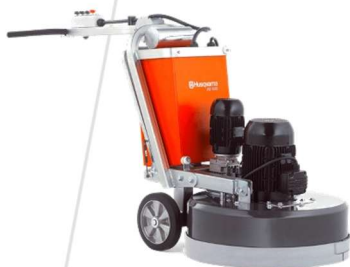
Politriz de Piso