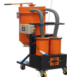
Aspirador de Pó