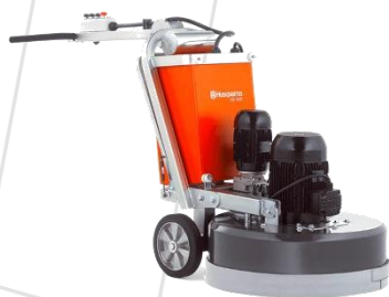
Politriz de Piso