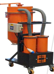
Aspirador de Pó