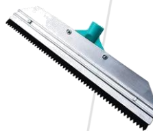
Rodo Metálico Dentado