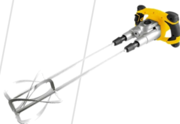
Misturador com Hélice Helicoidal Dupla