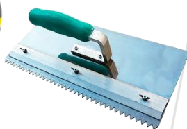
Despenadeira Metálica Dentada