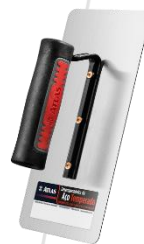
Desempenadeira Metálica Lisa