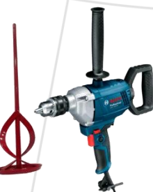
Misturador com Hélice Helicoidal