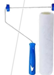
Rolo de lã sintética ref. 1365.

Nota: As imagens acima são de caráter ilustrativo e didático, com o intuito de facilitar a identificação do tipo de equipamento a ser utilizado, não estamos vinculados a nenhum fornecedor de ferramentas.