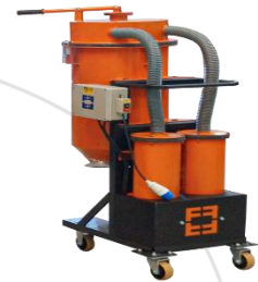
Aspirador de Pó