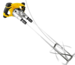
Misturador com Hélice Helicoidal Dupla