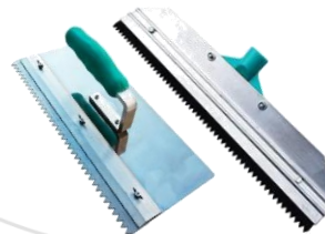
Rodo ou desempenadeira Metálica Dentada