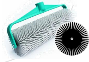
Rolo Fura Bolha

Nota: As imagens acima são de caráter ilustrativo e didático, com o intuito de facilitar a identificação do tipo de equipamento a ser utilizado, não estamos vinculados a nenhum fornecedor de ferramentas.