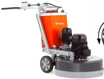
Politriz de Piso