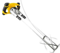
Misturador com Hélice Helicoidal Dupla