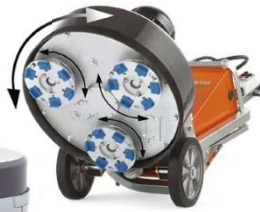
Fresadora de Piso de Concreto