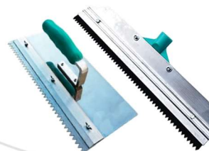
Rodo ou desempenadeira Metálica Dentada