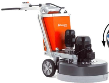
Politriz de Piso