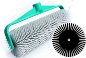
Rolo Fura Bolha

Nota: As imagens acima são de caráter ilustrativo e didático, com o intuito de facilitar a identificação do tipo de equipamento a ser utilizado, não estamos vinculados a nenhum fornecedor de ferramentas.