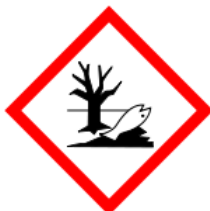
GHS09 Ambiente 2