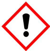
GHS07 Irritante para pele e olhos 2, Sensibilizante 1

Perigos mais importantes: Tóxico para organismos aquáticos, irritante para pele e olhos.