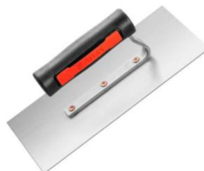
Despenadeira Metálica Lisa