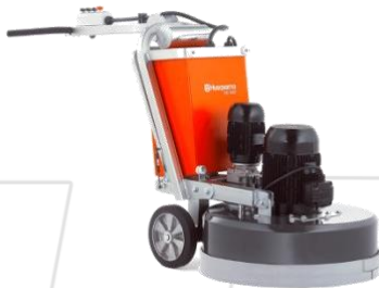
Politriz de Piso