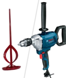
Misturador com Hélice Helicoidal