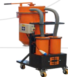
Aspirador de Pó