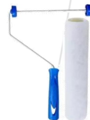
Rolo de lã sintética ref. 1365.

Nota: As imagens acima são de caráter ilustrativo e didático, com o intuito de facilitar a identificação do tipo de equipamento a ser utilizado, não estamos vinculados a nenhum fornecedor de ferramentas.